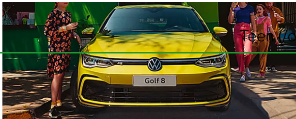
Golf 8 ibrida da 179€/mese TAN 3,49% TAEG 4,44% con Ecoincentivi Statali Volkswagen (https://bs.serving-sys.com/Serving/adServer.bs?cn=trd&pli=1076088109&gdrp=%24{GDPR}&gdrp_consent=%24{GDPR_CONSENT_681&adid=1082167976&ord=[timestamp]&obOrigUrl=true)