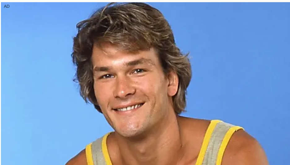
[Galleria] Il figlio di Patrick Swayze è cresciuto fino a somigliare a suo padre Novelodge

(https://rfvtgb.novelodge.com/worldwide/genes-ob-it?utm_medium=outbrain&utm_source=outbrainjk&utm_campaign=nl-genes-des-it-sg-20011&utm_term=$section_name$&obOrigUrl=true)