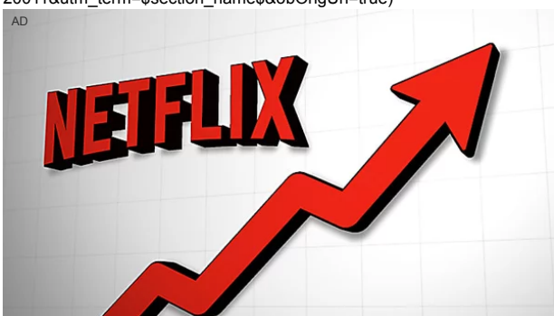
Cosa sarebbe successo se aveste investito $1K in Netflix un anno fa? eToro

(https://www.corpoperfetto.com/premium-collagen-complex/1/ob/?utm_source=outbrain&utm_medium=$publisher_id$&utm_campaign=00a38bd407526c5878ca3348f49886b70&utm_term=$section_name$&obOrigUrl=true)