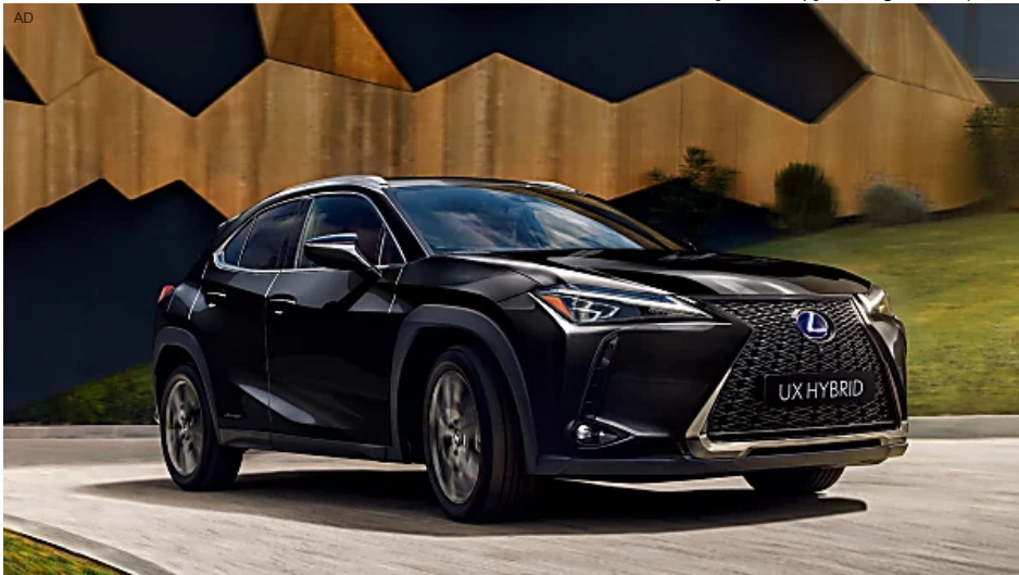
Nuovo Lexus UX. Fino a € 7.000 di Bonus con rottamazione. Lexus Italia (https://ad.doubleclick.net/ddm/trackclk/N526202.1599088OUTBRAIN_GM/B24975962.293325267;dc_trk_aid=482219439;dc_trk_sid=81656962;do_include_redirect_for_child_directed_treatment=true;tfua=;gdrp=%24{GDPR};gdrp_consent=;obOrigUrl=true)