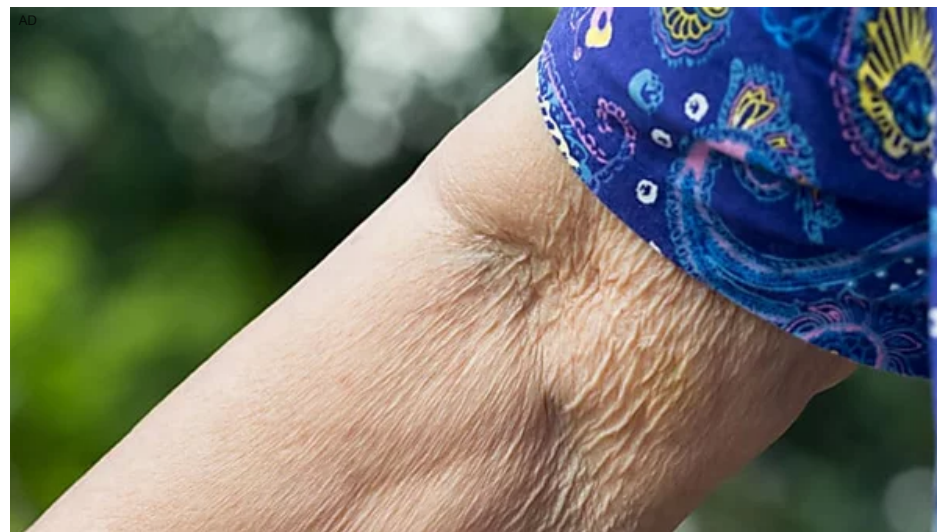
Sapevi che: "Il motivo principale per le rughe non è l'invecchiamento" Corpo Perfetto

(https://rfvtgb.novelodge.com/worldwide/genes-ob-it?utm_medium=outbrain&utm_source=outbrainjk&utm_campaign=nl-genes-des-it-sg-20011&utm_term=$section_name$&obOrigUrl=true)