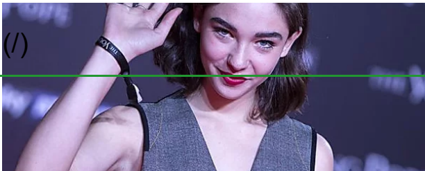
Tutto su Matilda De Angelis, da The Undoing a Sanremo il passo è breve ... (https://www.ansa.it/canale_lifestyle/notizie/people/2021/01/24/tutto-su-matilda-de-angelis-da-the-undoing-a-sanremo-il-passo-e-breve_01a89bd8-7c9e-49fc-8a3e-a0ebccf356fa.html?obOrigUrl=true)