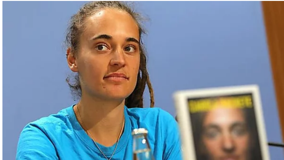
Germania: polizia ferma Carola Rackete in sgombero in una foresta - Mondo (https://www.ansa.it/sito/notizie/mondo/2020/11/12/germania-polizia-ferma-carola-rackete-in-sgombero-in-una-foresta_0c5154e5-b794-42b0-9409-1f6a100e4e.html?obOrigUrl=true)